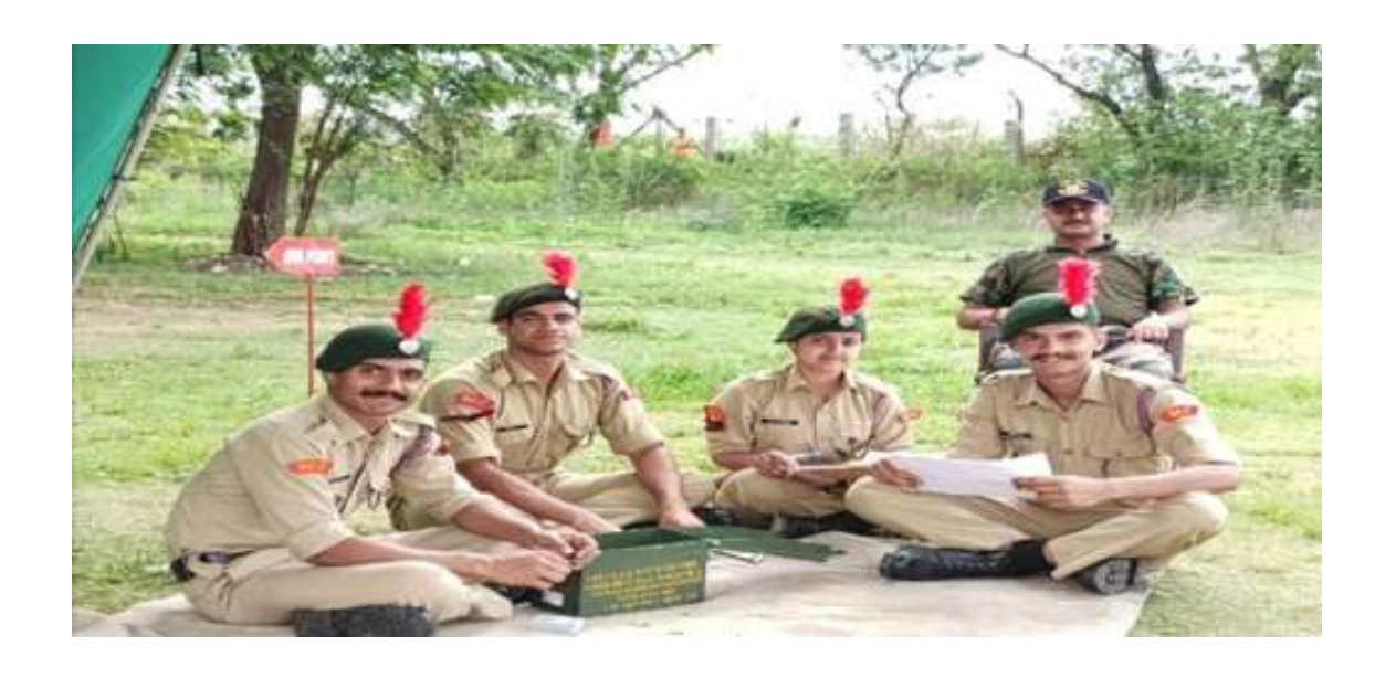
4. CATC Camp