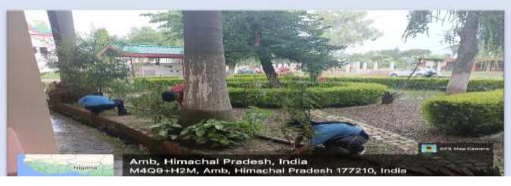
11. Cleanliness Drives