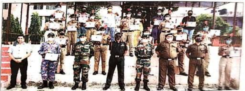
कोविड 19 महामारी में प्रशासन को सहयोग देने वाले एनसीसी कैडेट्स को सम्मानित करते अधिकारी। 🛲

कोविड-१९ महामारी में प्रशासन की मदद के साथ लोगों को किया जागरूक