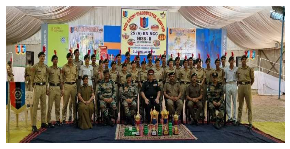
5. Participation in Ek-Bharat-Shrestha-Bharat camp, Tamil Nādu