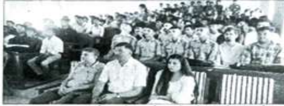
अंब: नशा मुक्त ऊना अभियान के अंतर्गत कालेज में नशा निषेध प्रहरी क्लब द्वारा नशे से संबंधित दुष्प्रभाव पर आधारित करवाए गए व्याख्यान के दौरान उपस्थित प्राचार्य, स्टाफ सदस्य व क्लब से जुड़े विद्यार्थी। एक गंभीर समस्या है। इससे न केवल संबंधित व्यक्ति प्रभावित होता है बल्कि

आज के युवा इन नशीले पदार्थों की गिरफ्त में दिन-प्रतिदिन फंसते जा रहे हैं जोकि हमारे समाज के लिए