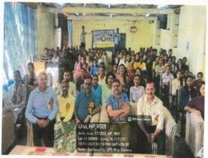
Una, HP 17201 Amb, Una, 17201, HP, 402 Lat: 31.68333, Long: 76.11416 10/11/2023 01:30 PM GMT+05:30 Note: Captured by GPS Map Camera