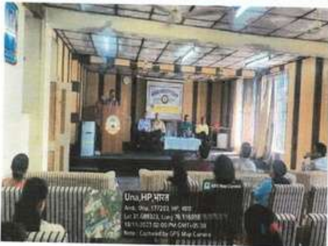
Una, HP 17201 Amb, Una, 17201, HP, 402 Lat: 31.68333, Long: 76.11416 10/11/2023 01:30 PM GMT+05:30 Note: Captured by GPS Map Camera