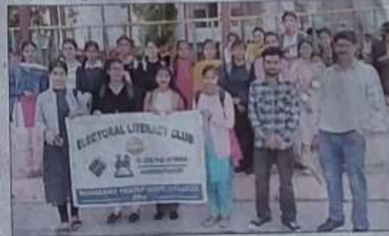
अम्ब : कालेज में आयोजित चुनावी पाठशाला कार्यशाला के दौरान विद्यार्थी नोडल अधिकारी के साथ संयुक्त चित्र में।