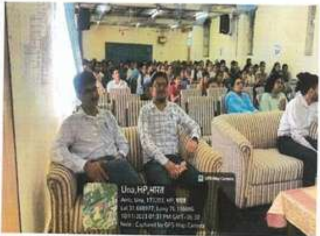
Una, HP 17201 Amb, Una, 17201, HP, 402 Lat: 31.68333, Long: 76.11416 10/11/2023 01:31 PM GMT+05:30 Note: Captured by GPS Map Camera