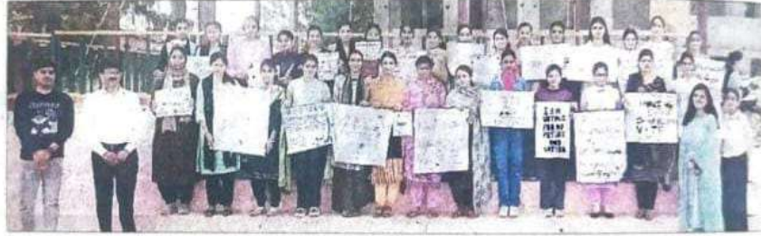
अम्ब : चुनावी साक्षरता क्लब द्वारा कालेज में आयोजित कार्यक्रम में विद्यार्थी नारा लेखन के चार्ट प्रदर्शित करते हुए।

and deceased family members. This is done to educate about the process related to removal. In displayed chart, students gave the message through slogan writing that all the voters who will complete 18 years of age on 30/4/2024 should register on the Voter Help Line App.