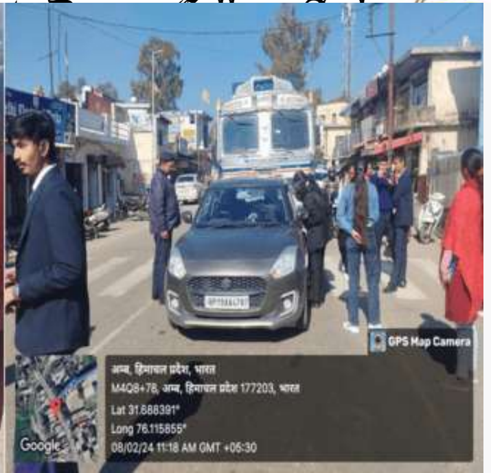
GPS Map Camera

अम्ब, हिमाचल प्रदेश, भारत M4Q8+78, अम्ब, हिमाचल प्रदेश 177203, भारत Lat 31.686391° Long 76.115855° 08/02/24 11:18 AM GMT +05:30