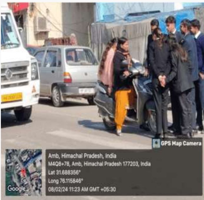
GPS Map Camera

Amb, Himachal Pradesh, India M4Q8+78, Amb, Himachal Pradesh 177203, India Lat 31.688358° Long 76.115846° 08/02/24 11:23 AM GMT +05:30