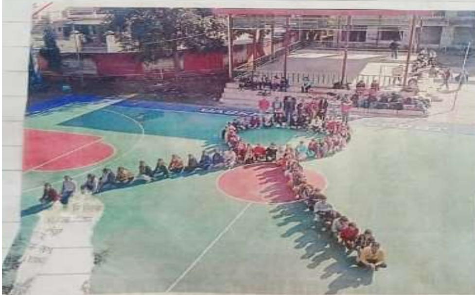
एड्स जागरूकता पर आभारित व्याख्यान के दौरान मानव भुंजका द्वारा एड्स प्रतीक बनाकर देना देते हुए एन.एस.एस. स्वयंसेवी।

समाचार पत्र: अमर हिमाचल दिनांक 14-11 अ : 08-12-2023