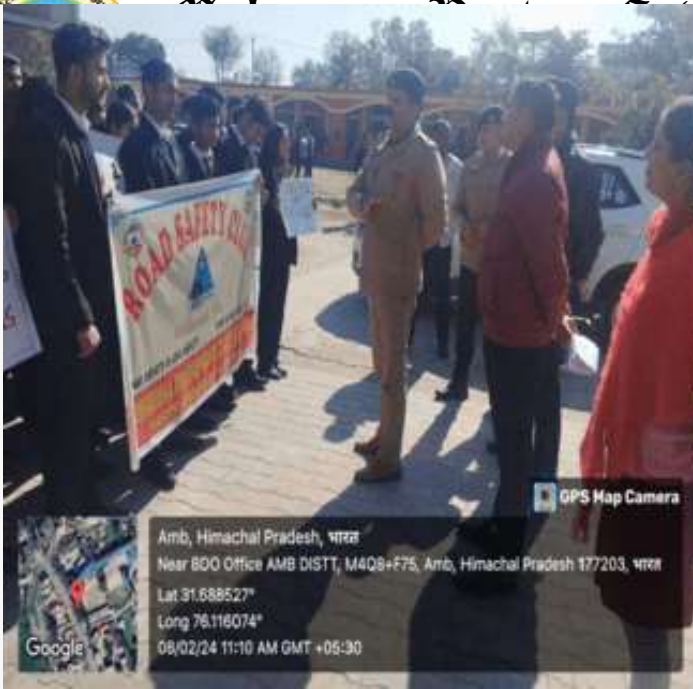
GPS Map Camera

Amb, Himachal Pradesh, भारत Near BDO Office AMB DISTT, M4Q8+775, Amb, Himachal Pradesh 177203, भारत Lat 31.688527° Long 76.116074° 08/02/24 11:10 AM GMT +05:30