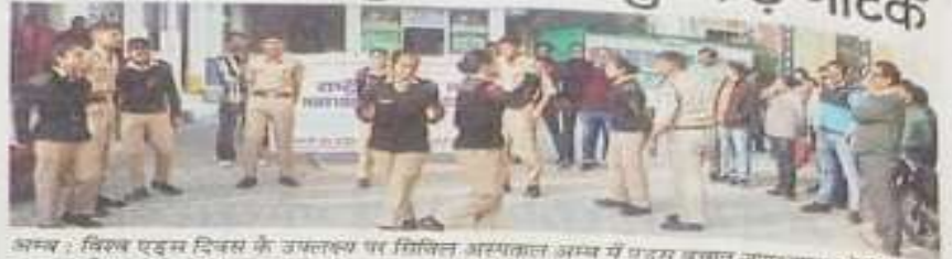
अम्ब : विश्व एड्स दिवस के उपलक्ष्य पर सिकिल अस्पताल अम्ब में एड्स बचाव जागरूकता को लेकर नुक्कड़ नाटक की प्रस्तुति देते हुए एन.सी.सी. यूनिट तथा रैड रिबन क्लब से जुड़े विद्यार्थी।