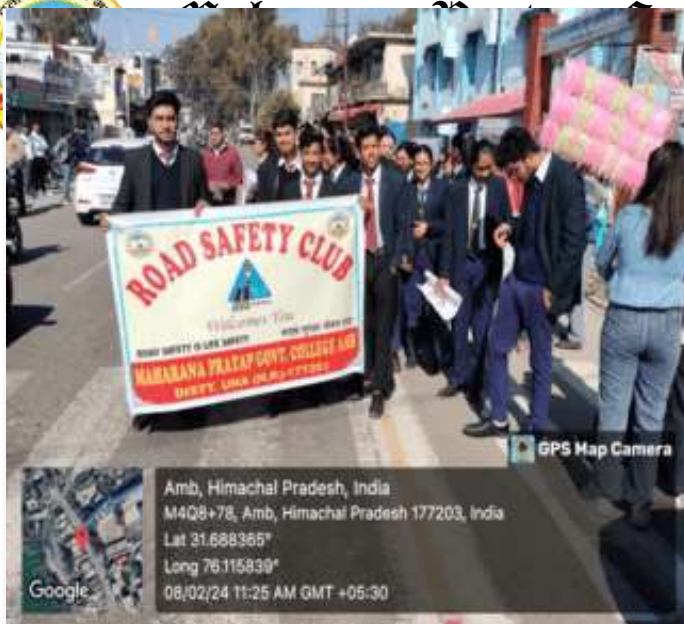
GPS Map Camera