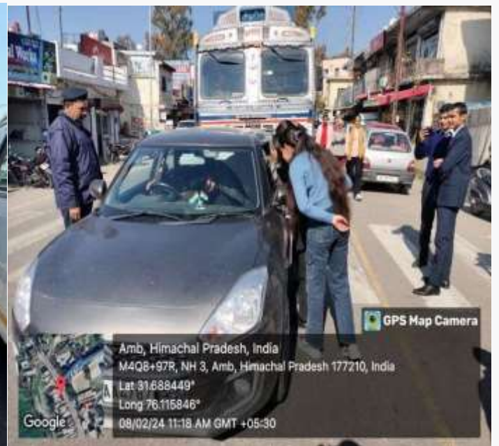
GPS Map Camera

Amb, Himachal Pradesh, India M4Q8+97R, NH 3, Amb, Himachal Pradesh 177210, India Lat 31.688449° Long 76.115846° 08/02/24 11:18 AM GMT +05:30