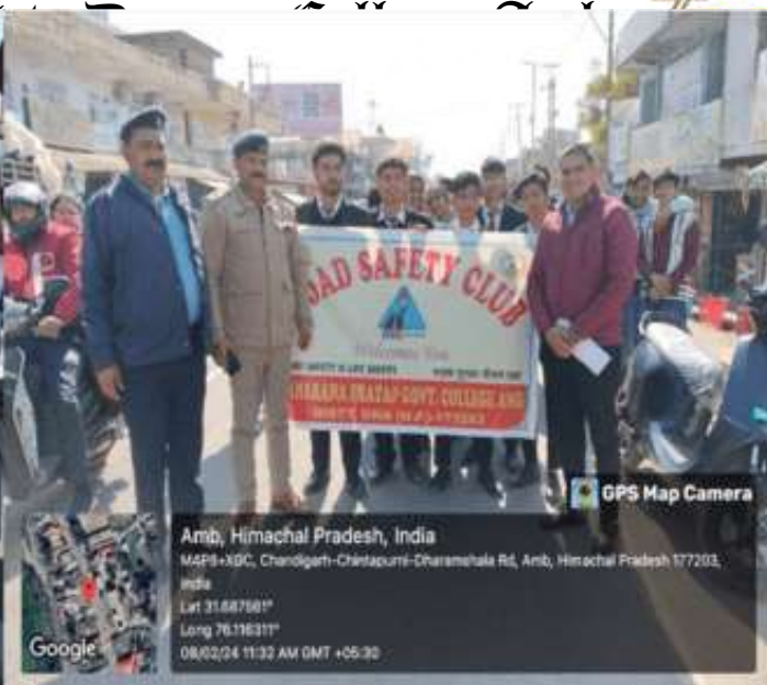
GPS Map Camera

Amb, Himachal Pradesh, India M4Q8+78, Amb, Himachal Pradesh 177203, India Lat 31.688365° Long 76.115839° 08/02/24 11:25 AM GMT +05:30