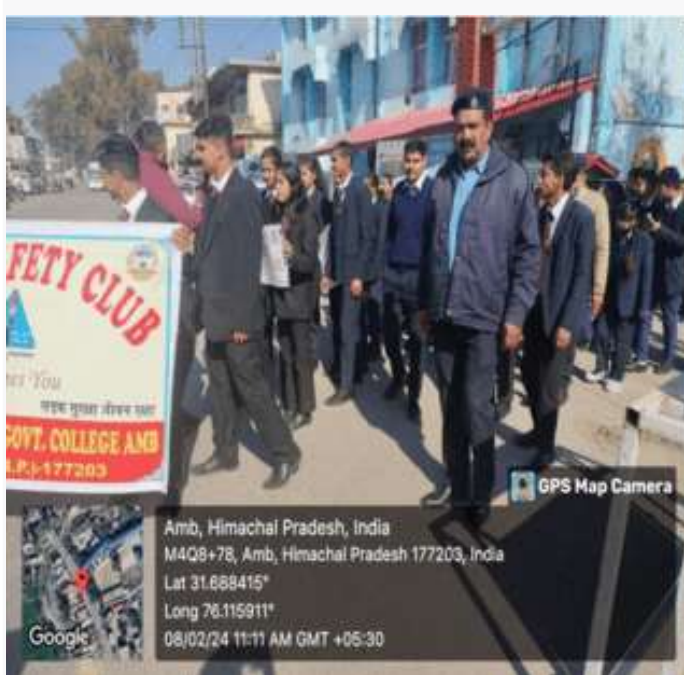
GPS Map Camera

Amb, Himachal Pradesh, India MAP8+3DC, Chandigarh-Chitlaipuri-Dharamshala Rd, Amb, Himachal Pradesh 177203, India Lat 31.687501° Long 76.116311° 08/02/24 11:32 AM GMT +05:30