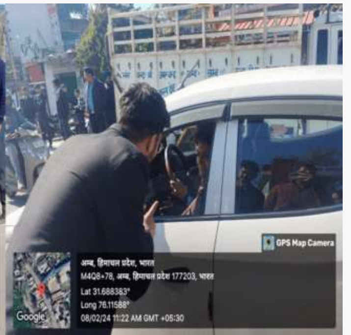
GPS Map Camera

अम्ब, हिमाचल प्रदेश, भारत M4Q8+78, अम्ब, हिमाचल प्रदेश 177203, भारत Lat 31.688383° Long 76.11588° 08/02/24 11:22 AM GMT +05:30