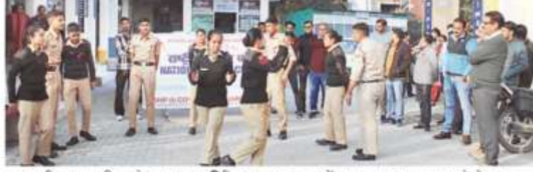
अम्ब : विश्व एड्स दिवस के उपलक्ष्य पर सिविल अस्पताल अम्ब में एड्स बचाव जागरूकता को लेकर नुक्कड़ नाटक की प्रस्तुति देते हुए एन.सी.सी. यूनिट तथा रैड रिबन क्लब से जुड़े विद्यार्थी।