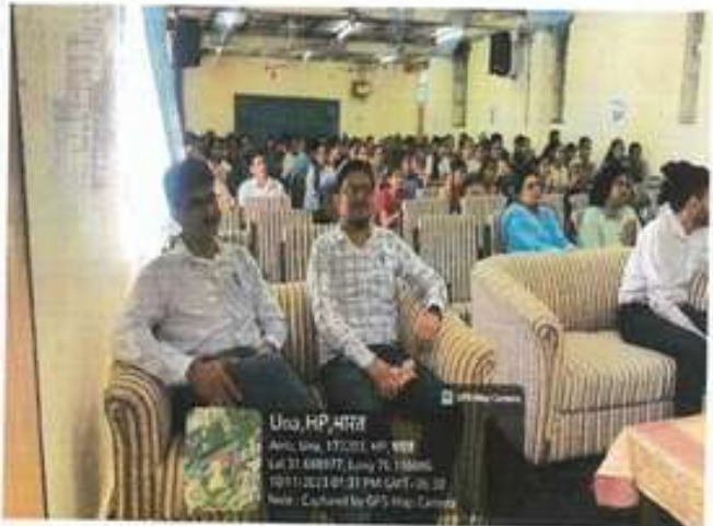
Una, HP 17203 Amb, Una, 17203, HP, 402 Lat: 31.68908, Long: 76.11436 10/11/2023 01:31 PM GMT+05:30 Note: Captured by GPS Map Camera