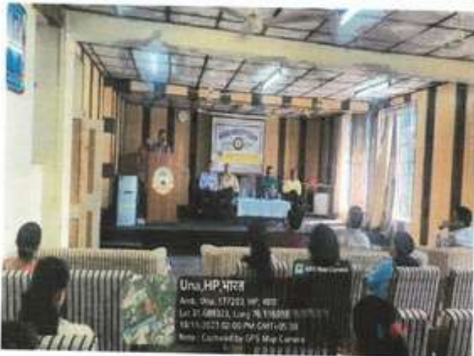
Una, HP 17203 Amb, Una, 17203, HP, 402 Lat: 31.68908, Long: 76.11436 10/11/2023 01:30 PM GMT+05:30 Note: Captured by GPS Map Camera