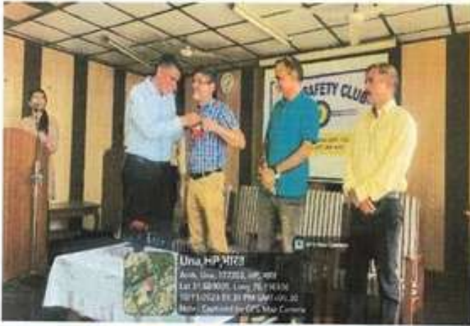
Una, HP 17203 Amb, Una, 17203, HP, 402 Lat: 31.68908, Long: 76.11436 10/11/2023 01:31 PM GMT+05:30 Note: Captured by GPS Map Camera