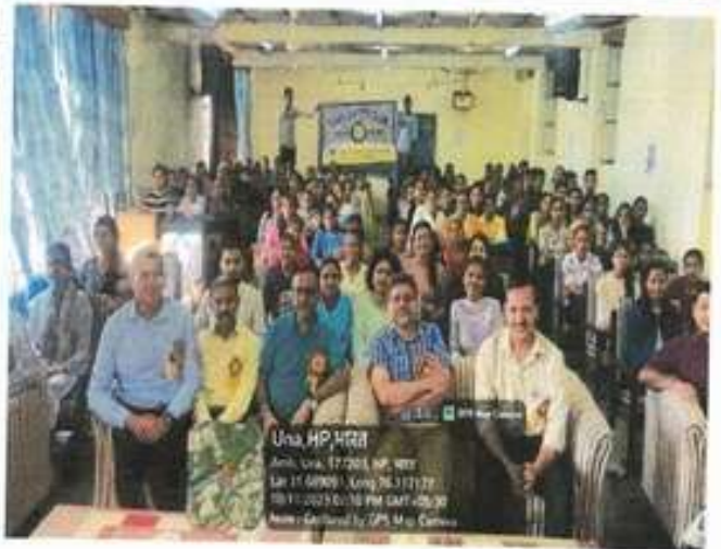
Una, HP 17203 Amb, Una, 17203, HP, 402 Lat: 31.68908, Long: 76.11436 10/11/2023 01:30 PM GMT+05:30 Note: Captured by GPS Map Camera