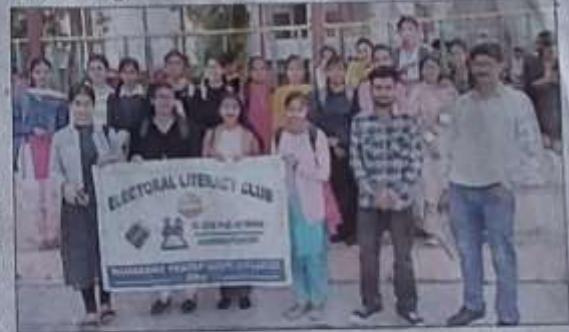
अम्ब : कालेज में आयोजित चुनावी पाठशाला कार्यशाला के दौरान विद्यार्थी नोडल अधिकारी के साथ संयुक्त चित्र में।