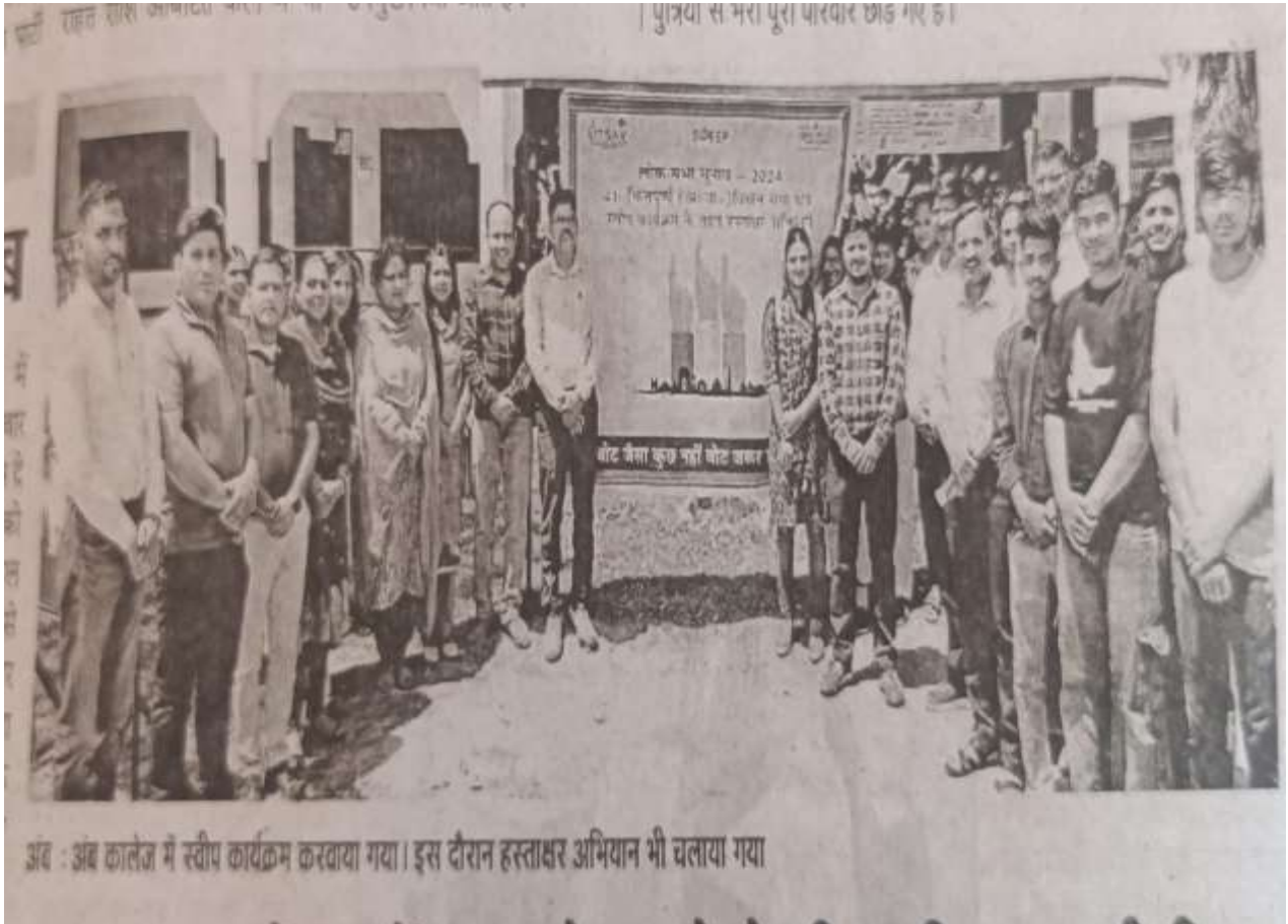
अंब : अंब कालेज में स्वीप कार्यक्रम करवाया गया। इस दौरान हस्ताक्षर अभियान भी चलाया गया।