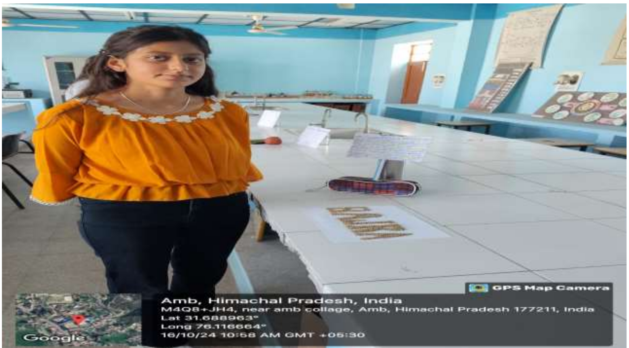
Students displaying exhibition