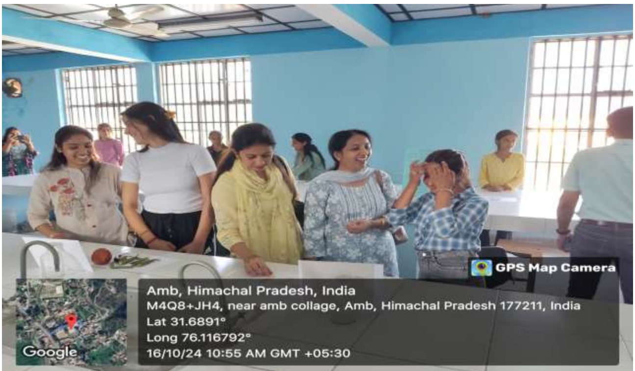
Participants of the function and students displaying the exhibition