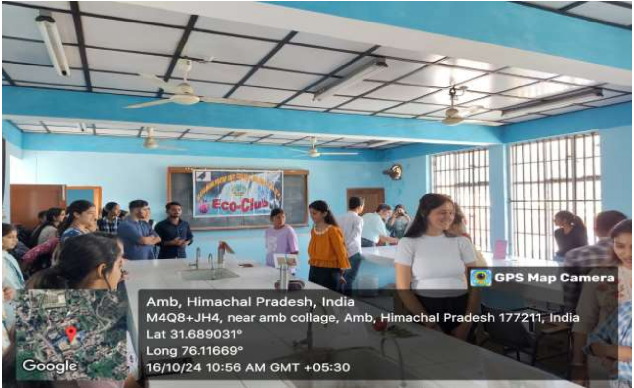
Students displaying exhibition of various millets, nuts, seeds, fruits etc.

www.mpgcamb.com | govtcollegeamb@gmail.com | mpgcamb@gmail.com | 01976-260032