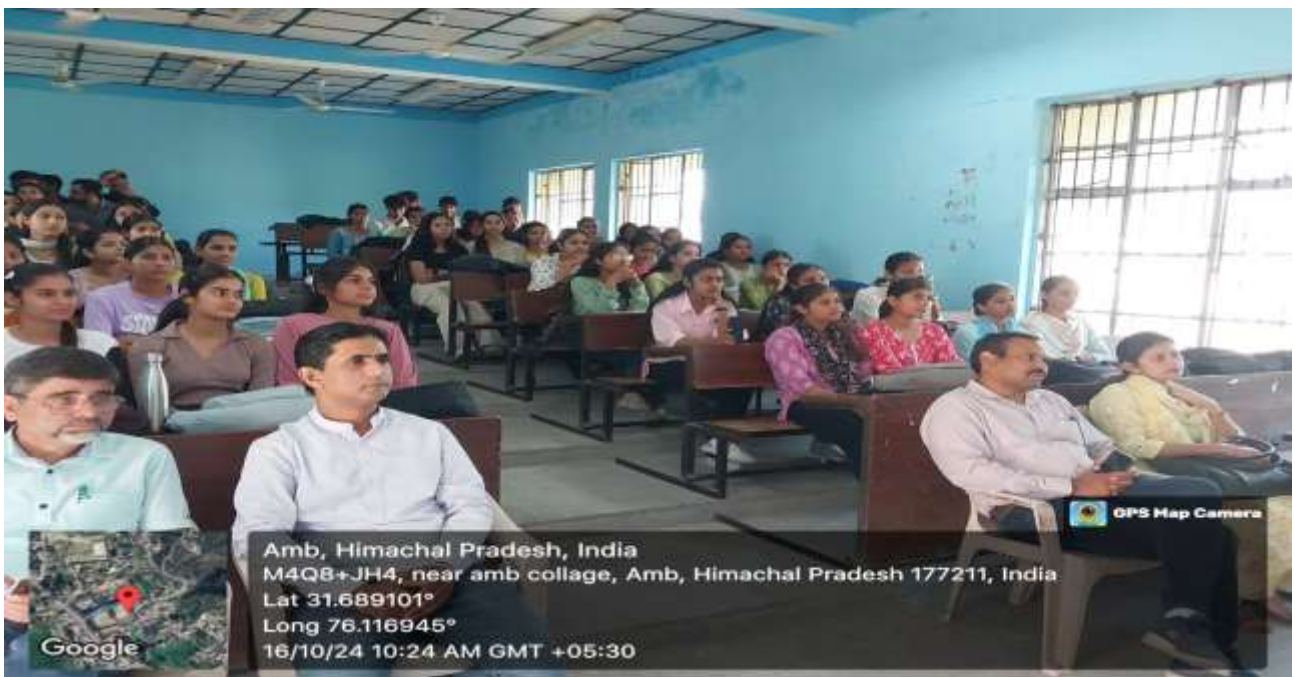
Participants of the function