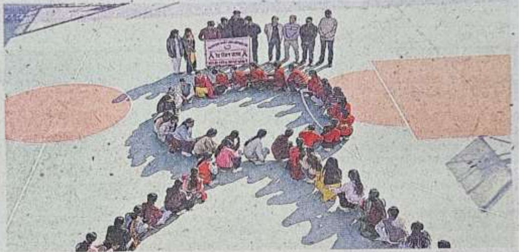
अंब कालेज में आयोजित कार्यक्रम के दौरान मानव श्रृंखला बनाकर एड्स के खिलाफ जागरूकता का संदेश देने विद्यार्थी