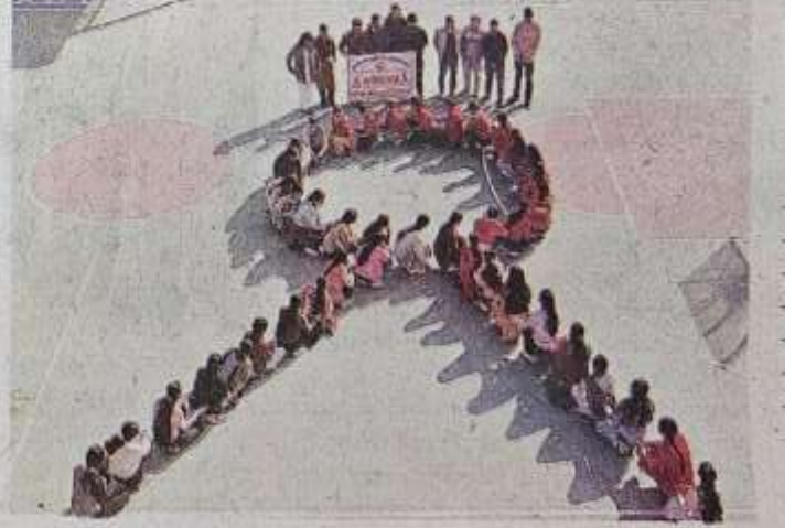
अम्ब : अम्ब कालेज में रेड रिबन क्लब द्वारा विश्व एड्स दिवस के उपलक्ष्य पर आयोजित कार्यक्रम में मानव श्रृंखला बनाए हुए क्लब के सदस्य एवं विद्यार्थी।